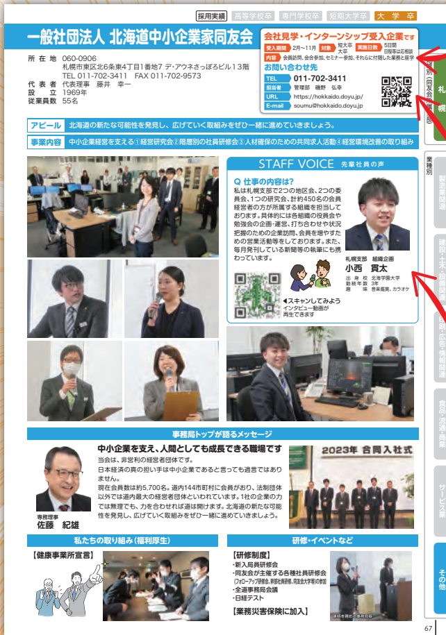
※2023年度版は122社が掲載

学生は会社のホームページを閲覧して会社情報を集めます。そこでホームページ上に掲載している各社の求人誌誌面に募集要項を掲載することで採用ページを作成します。中途求職者の募集にも対応します。(募集要項掲載、リンク費用無料、希望の掲載企業のみ対応)