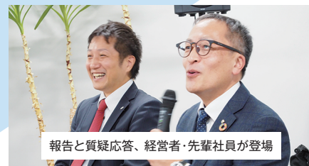
報告と質疑応答、経営者・先輩社員が登場