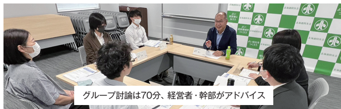
グループ討論は70分、経営者・幹部がアドバイス