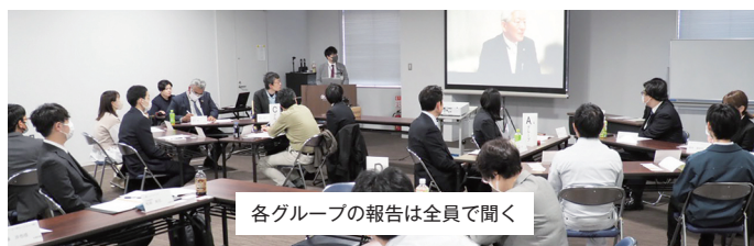
各グループの報告は全員で聞く