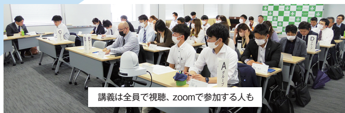
講義は全員で視聴、zoomで参加する人も